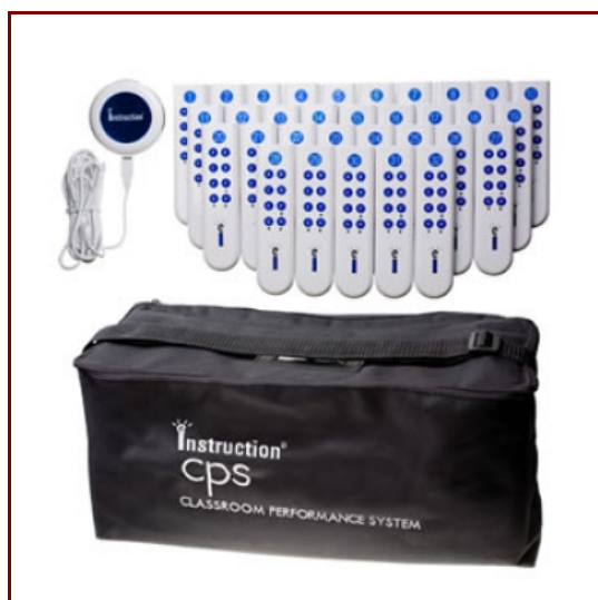
Obr. č. 1: IW CPS IR 32

V praxi jsme ověřili výrobek společnosti eInstruction . Společnost eInstruction nabízí pod souborem nástrojů Classroom Performance System (CPS) tzv. Student Response Systems – studentské hlasovací systémy, dále také interaktivní tabule, tablety apod.