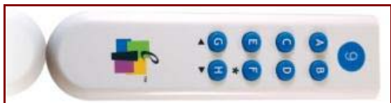
Obr. č. 2: Hlasovací stanice IW CPS IR 32; zdroj: http://www.datavideomedia.cz/b-akni-set-pro-skoly-/b-interwrite-cps-ir-32-nahrada-za-iw-prs-32-hlasovacich-zarizeni-bezdratovy-t_2/ , 201

Hlasovací zařízení se skládá z hlasovacích stanic (32 kusů), snímače infračervených signálů (hlavice) a kabelu USB (pro propojení snímače s počítačem). Po zapojení je zařízení automaticky detekováno a pro jeho správnou funkci je třeba nainstalovat ovladač. Jeho prostřednictvím pak můžete spouštět jednotlivé programy, které pracují s daty z přijímače nebo slouží k přípravě otázek. Nyní stručně popíšeme tyto aplikace.