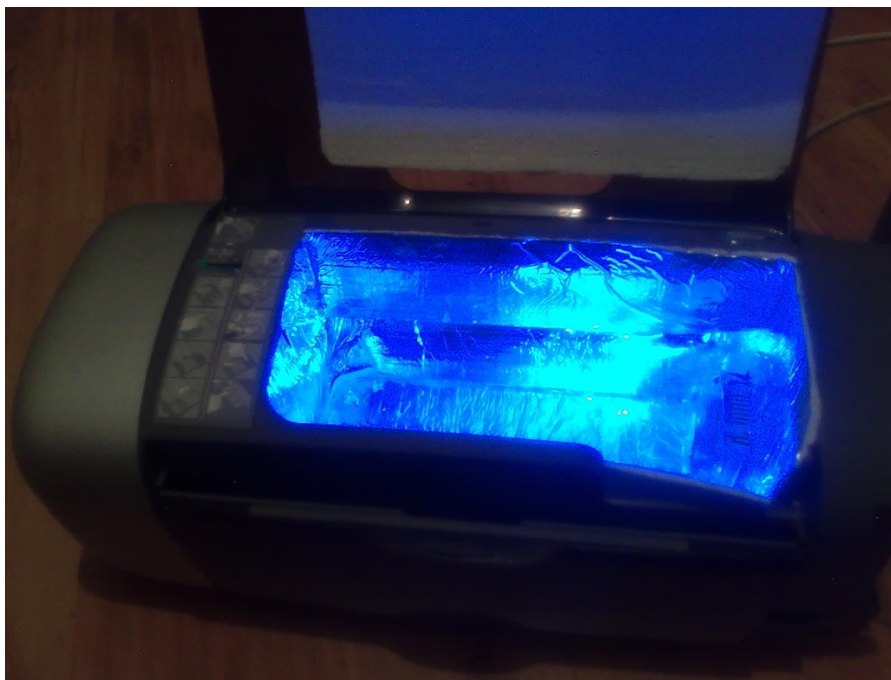
Rys. 4 Wnętrze mini lodówki