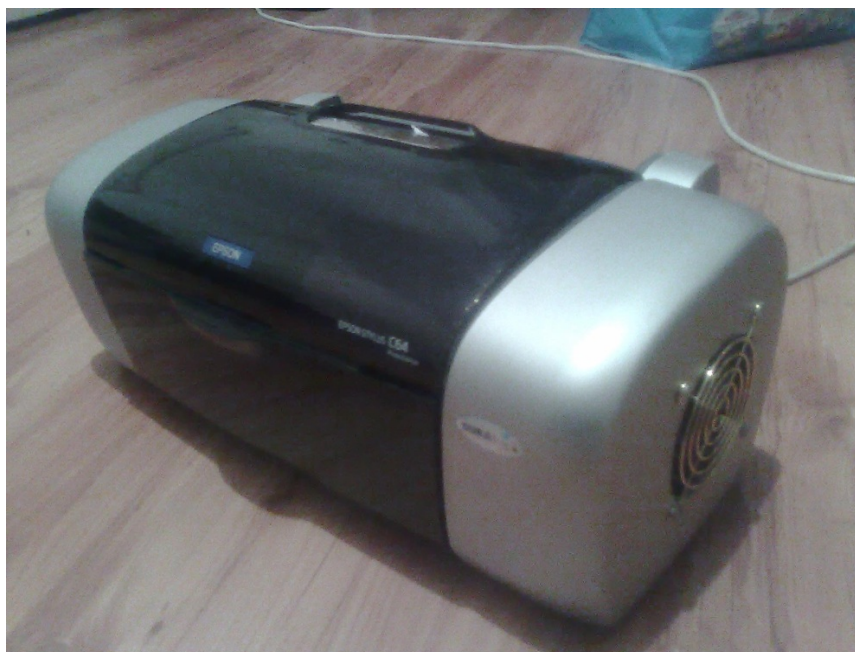
Rys. 3 Zewnętrzny wygląd mini lodówki

Ze względu na dużą ilość skondensowanej energii wydzielającej się ze strony "gorącej" ogniwa, zastosowano radiator wraz z wiatrakiem. Do połączenia użyto pasty termo-przewodzącej.