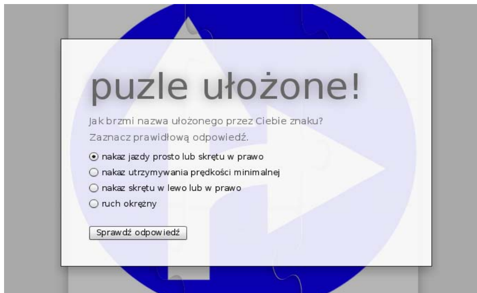
Rysunek 3. Fragment okna programu – sprawdzanie wiedzy gracza