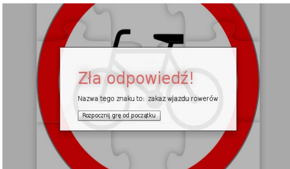
Rysunek 4. Fragment okna programu – komunikat o poprawnym znaczeniu znaku w przypadku złej odpowiedzi użytkownika

W trakcie pisania gry wykorzystano platformę Adobe Flex w wersji 4. Aplikacja powstała przy wykorzystaniu darmowego pakietu Flex SDK oraz darmowego edytora Flash-Develop. Pliki znaków drogowych pochodzą ze strony wikimedia.org i znajdują się one w domenie publicznej.