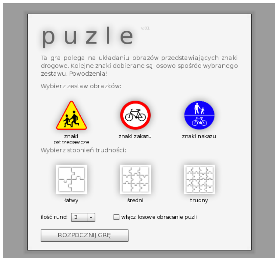
Rysunek 1. Menu główne gry

Poniżej przedstawiono dokładny opis obsługi interfejsu gry Puzzle. Po uruchomieniu programu ukazuje nam się główne menu aplikacji (rysunek 1). Przed przystąpieniem do gry musimy skonfigurować rozgrywkę. Najpierw należy wybrać rodzaj znaków jakie chcemy układać. Do wyboru mamy znaki: ostrzegawcze, zakazu oraz nakazu. Kolejnym etapem jest wybór stopnia trudności. aplikacja umożliwia nam wybór jednego z trzech stopni trudności: łatwy, średni oraz trudny. Im wyższy stopień trudności tym liczba elementów układanki wzrasta. W przypadku nie wybrania żadnej z opcji wartości zostaną dobrane losowo. Po wybraniu rodzaju znaków i stopnia trudności, istnieje możliwość ustawienia ilości rund, z których będzie się składała nasza rozgrywka. Rodzaje krawędzi puzzli dobierane są za każdym razem losowo. Nie ma więc możliwości rozwiązywania puzzli na pamięć.