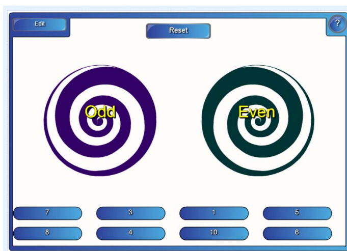
Obrázek č. 2 – aplikace Notebook spirály

Zde vybereme Soubory a stránky aplikace Notebook (pod tímto odvětvím se skrývají již předpřipravené aktivity, které stačí naplnit požadovanými údaji, v našem případě vzory podstatných jmen rodu mužského), kde nalezneme dvě možnosti třídění textu.