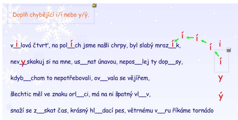
Obrázek č. 1 – nekonečný klonovač

Teoreticky máme hotovo, děti mohou začít doplňovat. To by však nesplnilo náš původní záměr interaktivního materiálu. Proto využijeme funkci nekonečný klonovač, jak název napovídá, můžeme jednotlivý prvek neustále klonovat a použít nespočetněkrát.