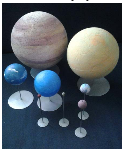
Obrázek 3: Planety s nerezovým stojánkem

Po vyrobení jednotlivých dílů se sololit natře na černo, když barva zaschne, sestaví se model do sebe. Na první dvě desky se naměří poloměr 68 cm a žlutě namalujeme část Slunce. Od okraje Slunce se naměří a znázorní oběžné dráhy. Mezi dráhy Marsu a Jupiteru se nakreslí tisíce asteroidů, tzv. hlavní pás planetek.