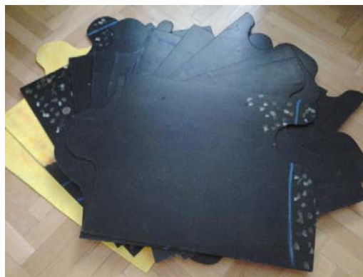
Obrázek 2: Hotový model, 13 dílů

V modelu byl využit systém puzzlí. Každý díl má specifický zářez a tak do sebe pasují vždy pouze dva díly. Vzhledem k materiálu byla pro řezání využita elektrická přímočará pila (kmitací pila). Ta je pro práci žáků nevhodná a nebezpečná, proto by se musel materiál nahradit tvrdým papírem nebo kartonem, aby žáci mohli využít nůžky. Model by ztratil určité vlastnosti (pevnost, stabilita), ale žáci by mohli model vyrobit bez cizí pomoci.