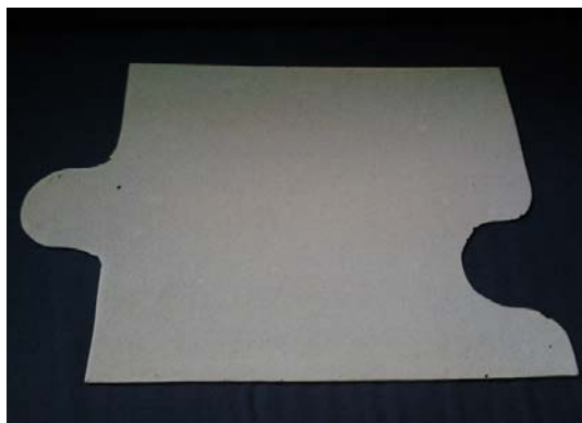
Obrázek 1: Ukázka dílu modelu, materiál sololit

Model je navržen v poměru 1:10^{12} , výsledná délka činí 5,5 m. Pro jeho výrobu bylo použito 13 dílů sololitu o rozměrech 420 x 500 mm (šířka x délka).