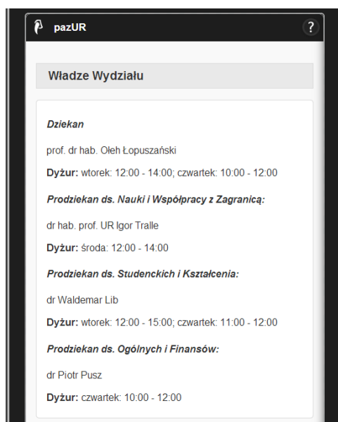
Obrazek 3. Wyświetlanie informacji na temat władz Wydziału Matematyczno-Przyrodniczego.

Następną funkcją znajdującą się w aplikacji „pazUR“ jest możliwość sprawdzenia dyżurów władz Wydziału Matematyczno-Przyrodniczego na Uniwersytecie Rzeszowskim oraz godzin prac dziekanatu. Użytkownik dzięki temu wie, do którego dziekana skierować odpowiednie pismo bądź podanie oraz w których godzinach można je złożyć. Co więcej, użytkownik dowie się, w jakich porach może załatwić sprawy związane z tokiem studiów w dziekanacie Wydziału oraz odnajdzie numer kontaktowy do osób pracujących w tym miejscu.