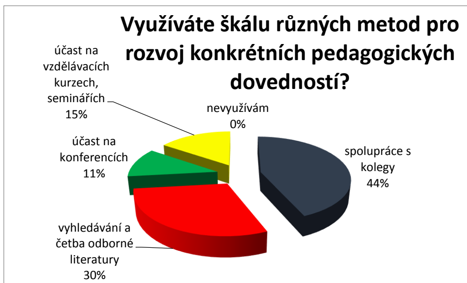
Graf č. 3

Na dotaz „Jakým způsobem se zajímáte o názor studentů na průběh a styl Vaší výuky?“ odpověděli učitelé následovně: formou diskuze 32%, 18% vyučujících získává zpětnou vazbu od studentů formou individuálního rozhovoru, 15% využívá k tomuto šetření dotazníkovou metodu a 35% vyučujících se studenty zpětnou vazbu vůbec neudržuje.