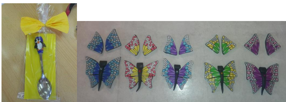
Obrázek 3 - Lžička s tučňákem - FIMO hmota